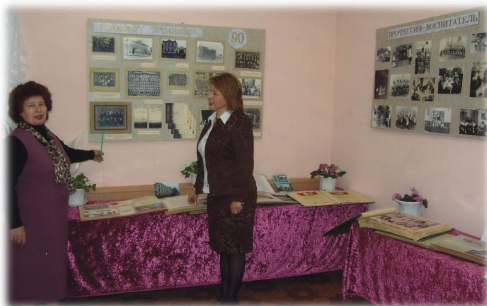
Экскурсия «Родному педучилищу - 90»